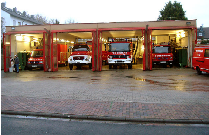
Der aktuelle Standort in der Zeilsheimer Straße