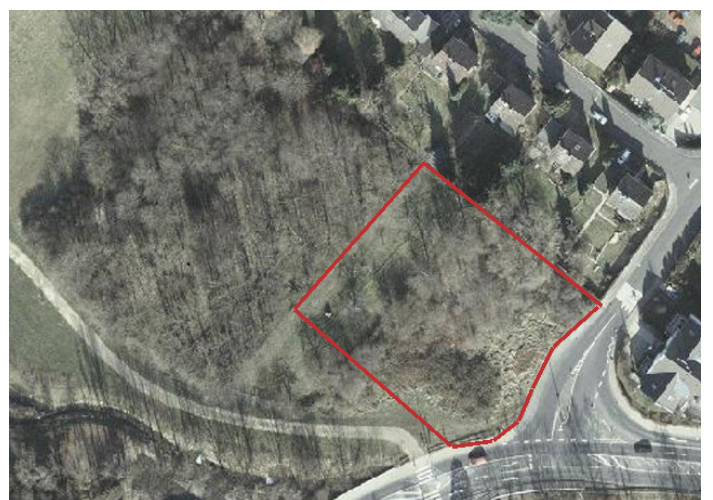
Luftbild des Grundstücks