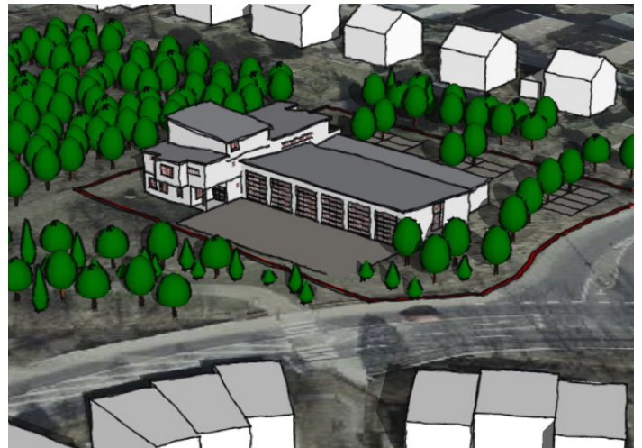
Studie einer möglichen Bebauung

Nach einer Analyse von neun möglichen Standorten